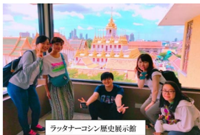
フラタナーコシン 歴史展示館

具体的には、 http://www2.igs.ocha.ac.jp/ait/ をご参照ください。