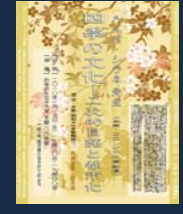
ハルオウ先生(東京大学) 「四重の文化—二次的・自然的・都市的」(2010年)