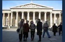
英国・ロンドン大学SOASとの共同ゼミ 「行き交うまなざし—古と今、東と西」(2009年)