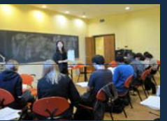
米国・ヴァッサー大学 教壇実習(2009年)

海外インターンシップ(教壇実習) 海外アカデミックディスカッション 海外調査研究