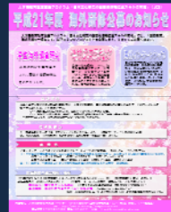
海外研修公募ポスター(2009年)