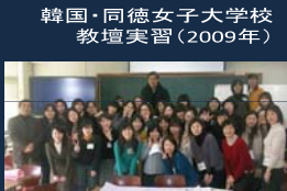
韓国・同徳女子大学校 教壇実習(2009年)